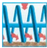
Elsimítja a talajt